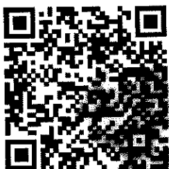
สิ่งที่ส่งมาด้วย ๕

แบบยินยอมในการเข้าตรวจดูข้อมูลข่าวสารส่วนบุคคล