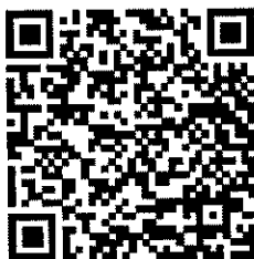
สิ่งที่ส่งมาด้วย ๔

แบบรายงานการขอพระราชทานเครื่องราชอิสริยาภรณ์ อันเป็นสิริยิ่งรามเกียรติ์ ลูกเสือสดุดีชั้นพิเศษ